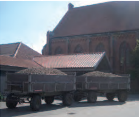
Es wäre doch schade, wenn nur Kartoffeln gebracht würden!

Außerdem soll in diesem Jahr ein besonderer Akzent gesetzt werden: Mit einer Wandelkommunion um den Altar wird das Heilige Abendmahl mit einer Dankkollekte verbunden. Das heißt, wer zum Abendmahl kommt, geht um den Altar herum und kann dort seine Dankgabe in einen Kollektenbehälter einlegen, um auf diese Weise unserm HERRN für die eigene „Jahresernte“ zu danken. Die Kollekte wird für unsere Missionsprojekte gesammelt. H.H.H.