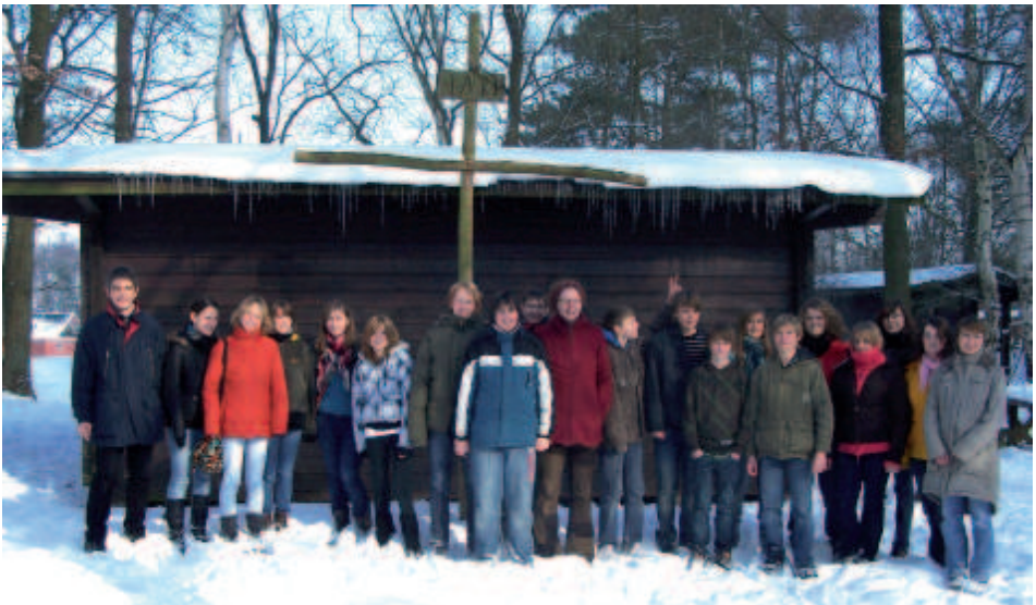
Tolle Abschlussfreizeit der Konfirmanden vom 11. - 14. Februar im Jugenddorf Molzen!