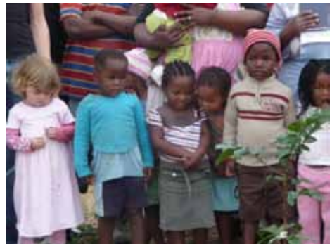
Im Juni 2009: Kinder auf Thuthukani

Von Freitag, 9. Juli, ab 17 Uhr bis Sonntag, 11. Juli sind Konfirmanden, frisch Konfirmierte und Jugendliche bis ca. 16 Jahren eingeladen, am Missionswochenende teilzunehmen. Im Angebot ist eine thematische Bibelarbeit und ein Referat, das uns die Missionsarbeit in Brasilien vor Augen führt. Spiel, Spaß und Musik gehören ebenso wie das Zelten (und Grillen) dazu. „Public Viewing“ zum Thema Fußball ist ebenfalls eingeplant und offiziell beantragt. Siehe auch die ausgehängten Poster zum Missionsfest und Wochenende insgesamt. M.N.