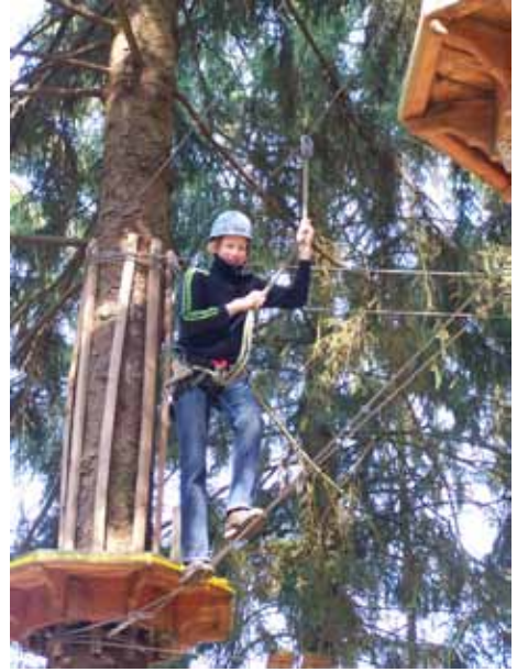
Doppelt gesichert über das Seil in luftiger Höhe!

Zum Abschluss der gemeinsamen Konfirmandenzeit radelten wir am Montag nach der Konfirmation bei kühlem Wind nach Müden, um im Hochseilgarten zu klettern. Für alle Konfis, Diakonin und Pastor ein echt tolles Erlebnis mit ganz unterschiedlichen Herausforderungen. Als wir nach der Rücktour im Gemeindesaal eintrafen, wurden wir mit Kuchen und Getränken empfangen. W.K.