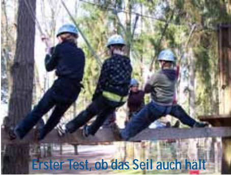
Erster Test, ob das Seil auch hält

Zum Abschluss der gemeinsamen Konfirmandenzeit radelten wir am Montag nach der Konfirmation bei kühlem Wind nach Müden, um im Hochseilgarten zu klettern. Für alle Konfis, Diakonin und Pastor ein echt tolles Erlebnis mit ganz unterschiedlichen Herausforderungen. Als wir nach der Rücktour im Gemeindesaal eintrafen, wurden wir mit Kuchen und Getränken empfangen. W.K.