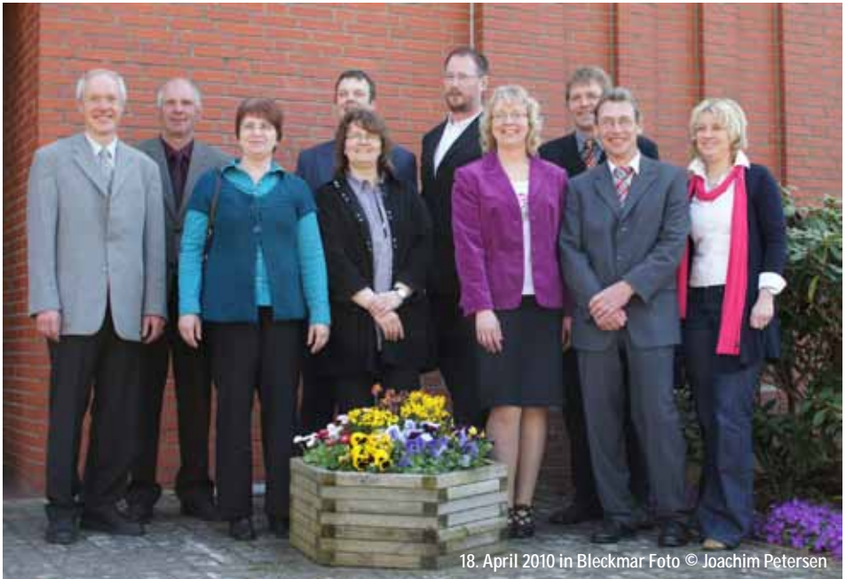
18. April 2010 in Bleckmar