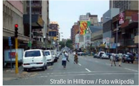
Straße in Hillbrow

Ein weiterer großer Bereich meiner Arbeit ist, der „Mann für alles“ zu sein. Reparaturen an Türen, Tischen, Kirchenglocken, Fenstern usw. gehören dabei zur Tagesaufgabe. Nebenbei engagiere ich mich am