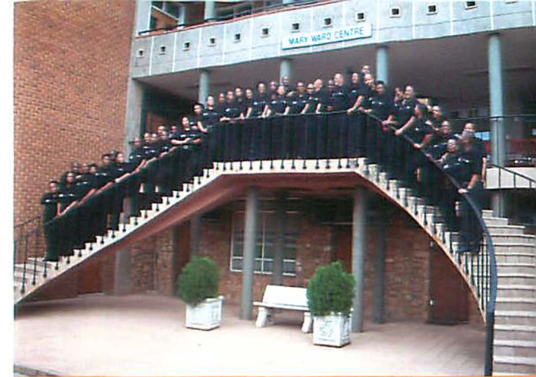
„Akasia Lutheran Church Choir“

In der Zeit von 10:00 Uhr - 12:30 Uhr und von 14:00 Uhr - 16:00 Uhr wird eine Kinderbetreuung angeboten.